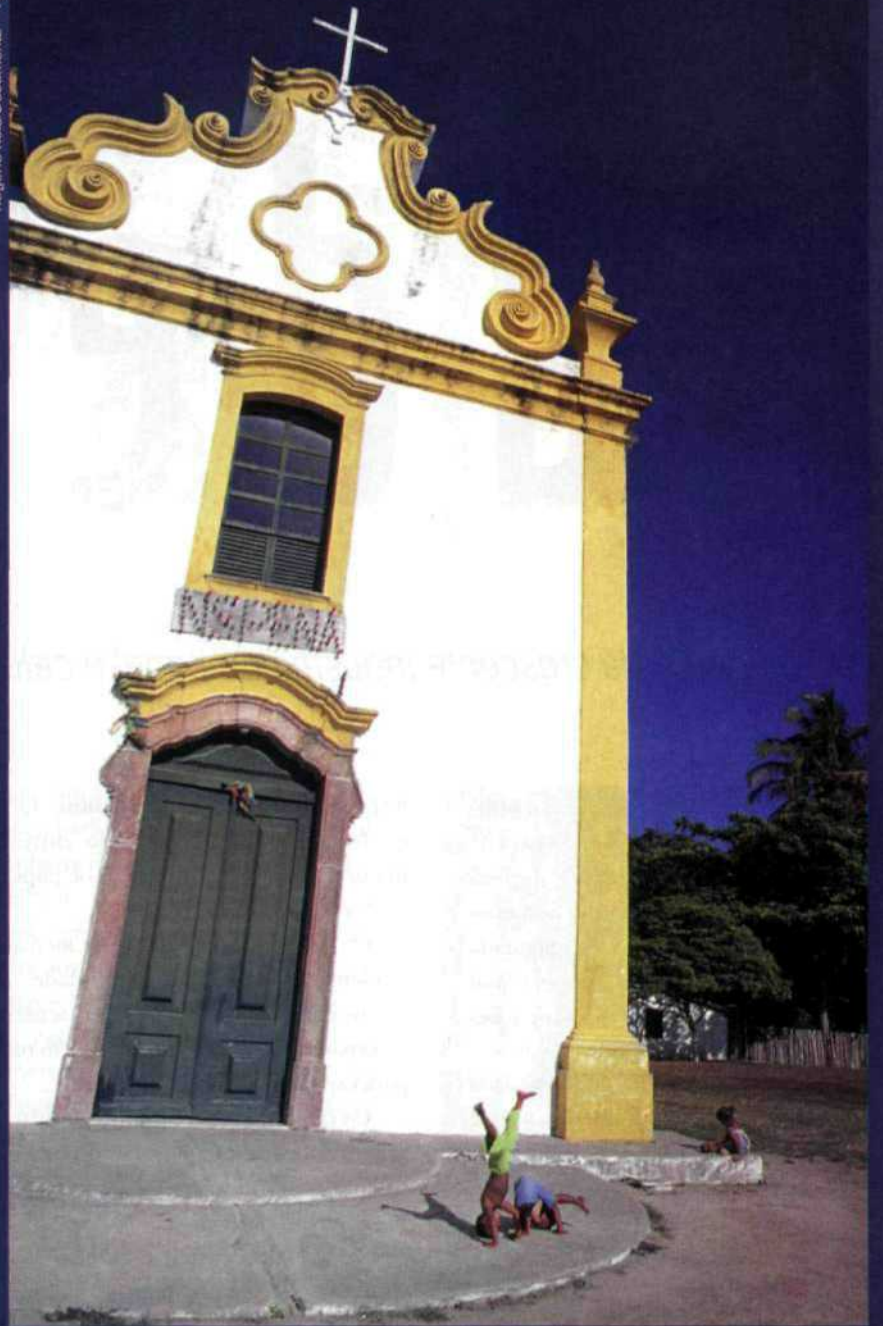
A igreja de N. S. da Penha, em Porto Segura, está sendo restaurada com auxílio da comunidade

struções do Brasil Colônia. A igreja Nossa Senhora da Penha guarda imagens sacras dos séculos XVI e XVII, entre elas a de São Francisco de Assis (primeira imagem sacra trazida para o Brasil).