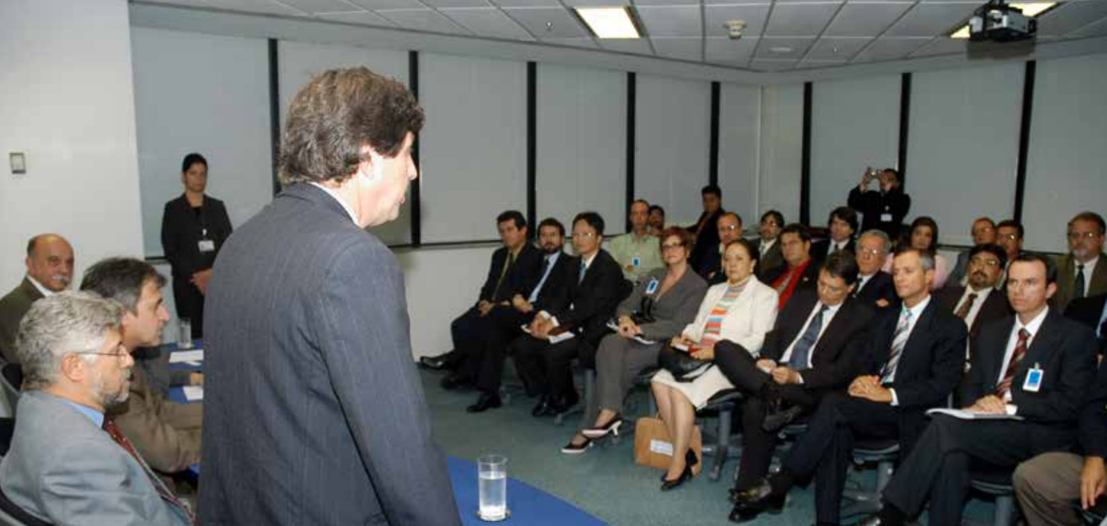
Solenidade de instalação do GT do novo Estatuto da Funcef - 2006