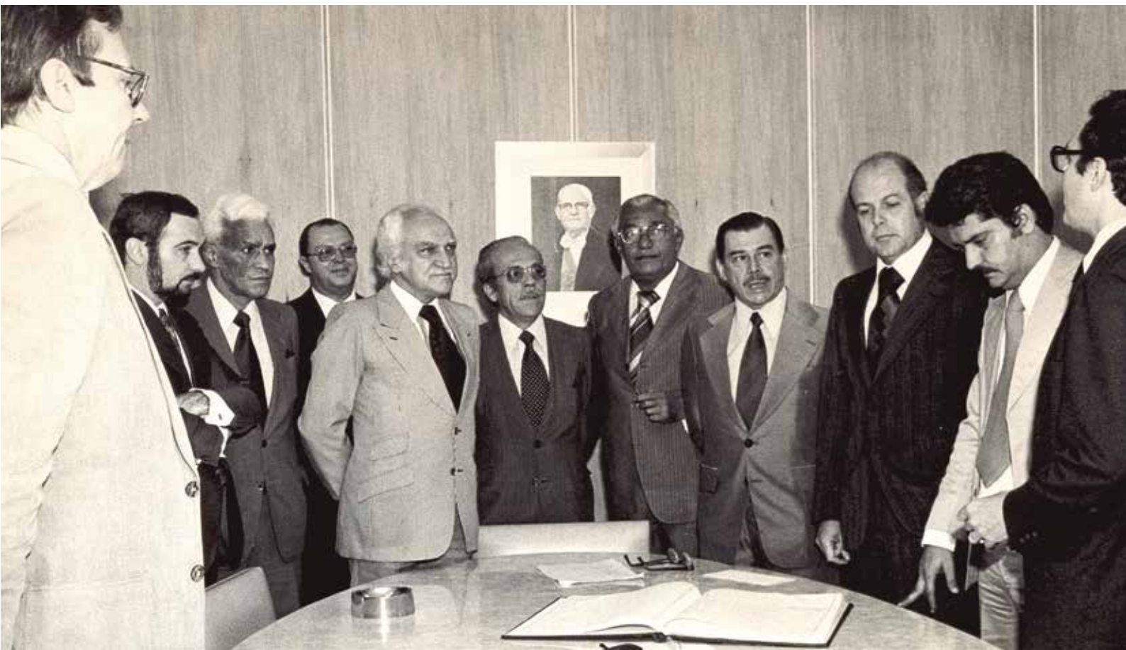
Cerimônia que marcou a implantação da Funcef em 1977

Tudo foi possível virar realidade com maior participação de todos. Na atual conjuntura nacional, em que a ameaça de privatização da Caixa volta à tona e se tenta impor mudanças unilaterais na Funcef, a Fenaes tem certeza de que é preciso aglutinar forças em defesa da Caixa, da democracia e dos direitos.